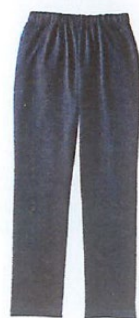
S~LL 共通 チャコールグレー